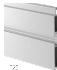
T25 AD INVERSIONE