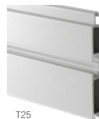
T25 AD INVERSIONE