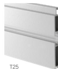
T25 AD INVERSIONE